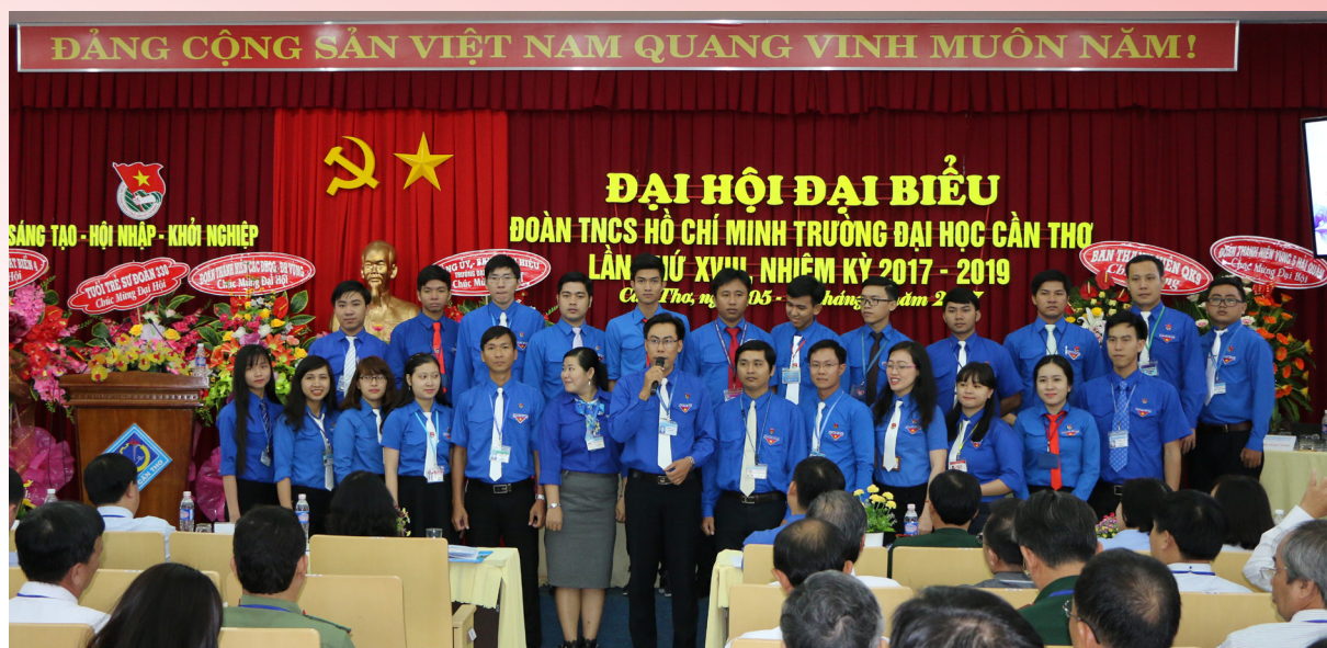
Ban Chấp hành nhiệm kỳ mới ra mắt Đại hội.

Đồng thời, Đại hội cũng bầu ra 18 cán bộ, đoàn viên, thanh niên ưu tú đại diện cho tuổi trẻ Trường ĐHCT tham dự Đại hội đại biểu Đoàn TNCS Hồ Chí Minh thành phố Cần Thơ nhiệm kỳ 2017-2022.