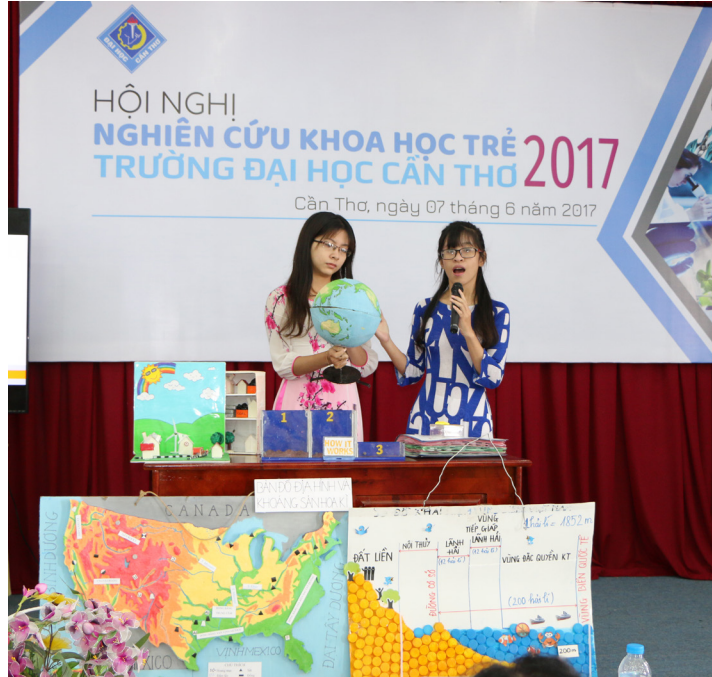
Chủ nhiệm đề tài tiêu biểu báo cáo tại Hội nghị.

Với giải thưởng “Sinh viên NCKH” do Bộ Giáo dục và Đào tạo tổ chức năm 2016, sinh viên của