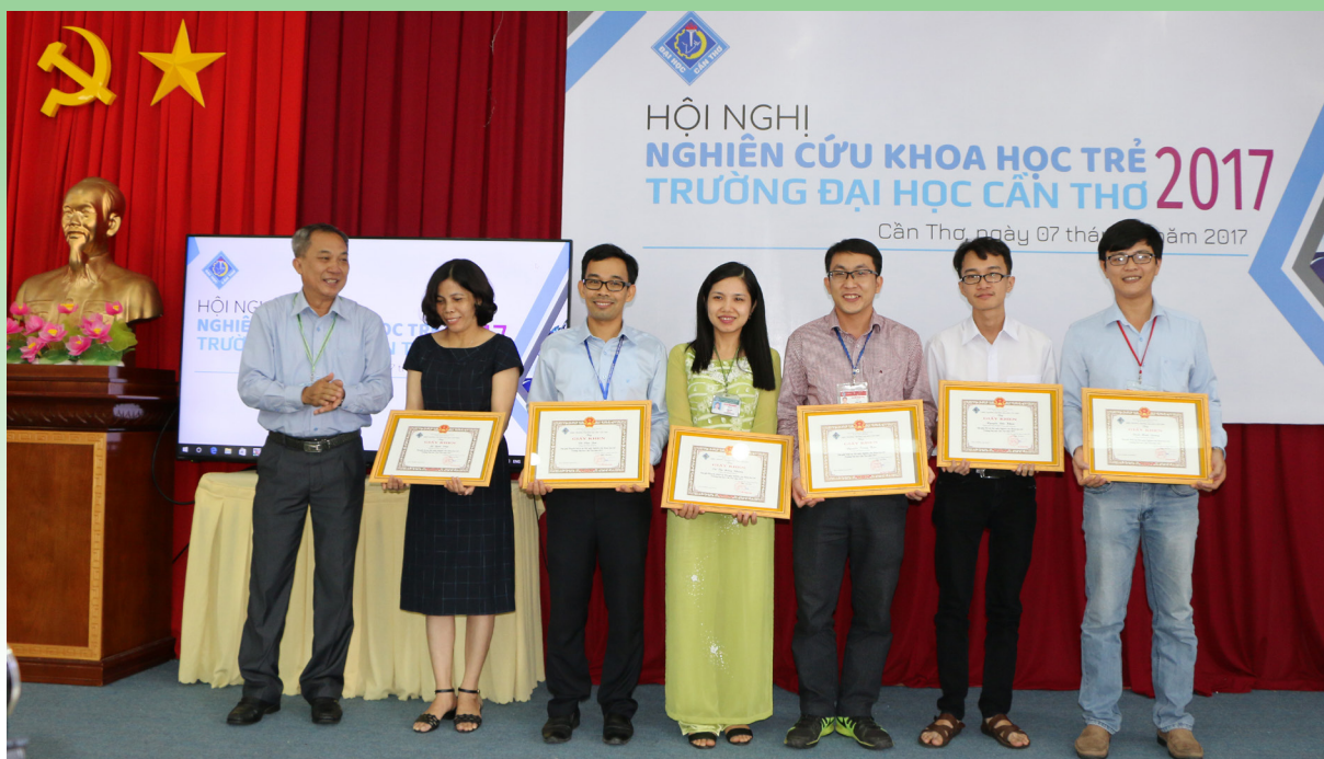
Trao giải “Tài năng NCKH trẻ Trường ĐHTC” năm 2017 cho 06 công trình của cán bộ trẻ.