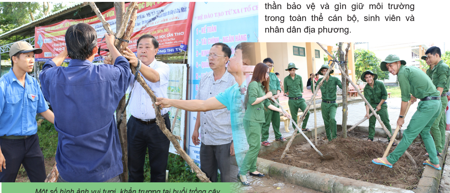
Một số hình ảnh vui tươi, khẩn trương tại buổi trồng cây.

Hoạt động trồng cây đầy ý nghĩa của Trường ĐHCT và sự chung tay góp sức của lãnh đạo tỉnh Hậu Giang sẽ góp phần thắt chặt hơn tình cảm gắn bó giữa Nhà trường và địa phương, quan trọng hơn hết là nâng cao hơn nữa tinh thần bảo vệ và gìn giữ môi trường trong toàn thể cán bộ, sinh viên và nhân dân địa phương.