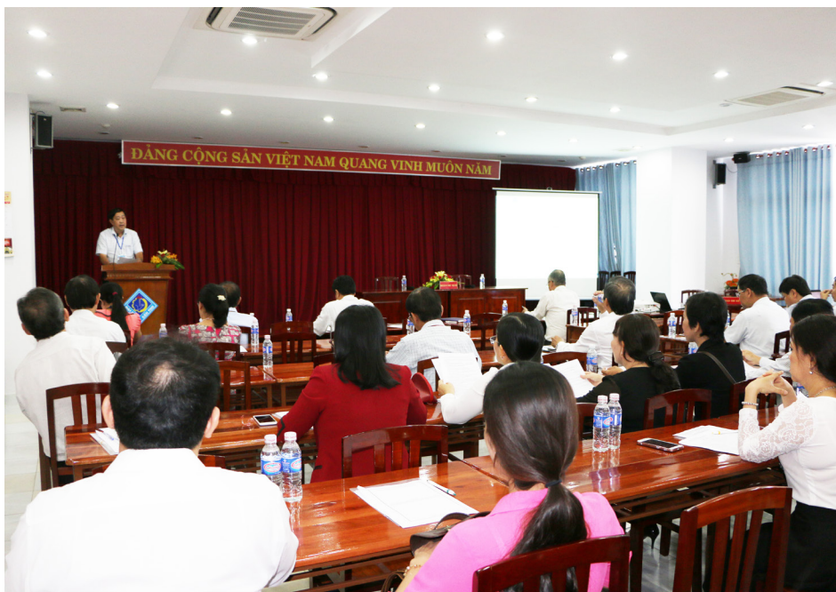
Hội nghị Tổng kết hoạt động SX-DV giai đoạn 2013-2016 và Kế hoạch hoạt động năm 2017 diễn ra tại Nhà Điều hành, Trường ĐHCT.