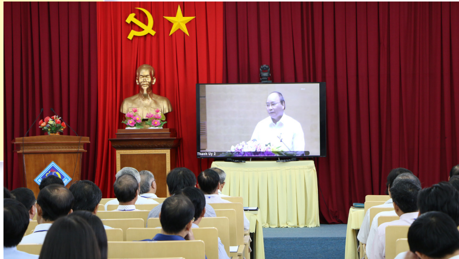
Buổi học tập Nghị quyết Hội nghị lần thứ năm Ban Chấp hành Trung ương Đảng khóa XII tại Trường Đại học Cần Thơ.

động lực quan trọng của nền kinh tế thị trường định hướng xã hội chủ nghĩa (Nghị quyết số 10-NQ/TW); Nghị quyết về hoàn thiện thể chế kinh tế thị trường định hướng xã hội chủ nghĩa (Nghị quyết số 11-NQ/TW); Nghị quyết về tiếp tục cơ cấu lại, đổi mới và nâng cao hiệu quả