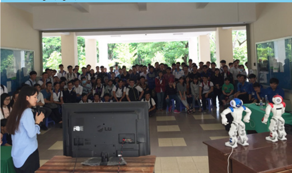
Cán bộ và sinh viên đang chú ý phần thuyết trình kết hợp với trình diễn của NAO.

cho Softbank và tất cả đều được giải đáp thỏa đáng. Buổi trình diễn của NAO không những truyền tải thông tin khoa học bổ ích mà còn truyền nguồn cảm hứng cho sinh viên đam mê nghiên cứu trong lĩnh vực robot. Hy vọng trong tương lai gần, NAO sẽ trở lại Trường ĐHCT cùng PEPPER và ROMEO với những màn trình diễn hấp dẫn hơn nữa.