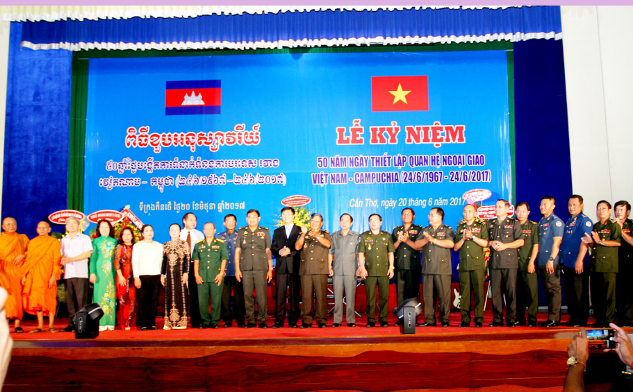
Đoàn đại biểu Quân đội hoàng gia Campuchia và lãnh đạo TP. Cần Thơ chụp hình lưu niệm.

tặng quà cho nhân dân ở 05 huyện thuộc tỉnh Kom Pong Spư, Vương quốc Campuchia. Đây là một trong những hoạt động mang ý nghĩa thiết thực, thể hiện mối quan hệ hữu nghị đoàn kết keo sơn gắn bó giữa nhân dân hai nước Việt Nam và Campuchia thông qua việc trao đổi kinh nghiệm trong công tác chăm sóc sức khỏe, thực hiện cấp thuốc kịp thời cho những đối tượng có nhu cầu.