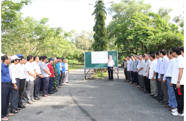
Đoàn Trường ĐHCT và lãnh đạo tỉnh Hậu Giang tham gia trồng cây tại khu Hòa An sáng ngày 04/6/2017.

Buổi trồng cây đã diễn ra trong không khí vui tươi, phấn khởi với sự tham gia của Đảng ủy, Ban Giám hiệu, lãnh đạo các đơn vị khoa, viện, phòng ban, trung tâm và sinh viên của Trường. Đặc biệt, tham gia cùng với Trường còn có lãnh đạo Đảng, chính quyền tỉnh Hậu Giang. Đây được xem là nguồn cổ vũ, động viên lớn lao cho tập thể cán bộ Nhà trường, đồng thời thể hiện tinh thần trách nhiệm của địa phương trong công cuộc xây dựng Hòa An trở thành khu đào tạo