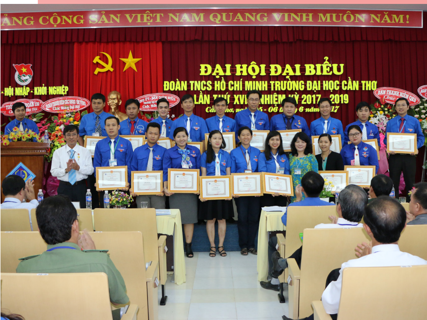
Các đồng chí nhận khen thưởng của Hiệu trưởng Trường ĐHCT.

đạo của Đảng ủy-Ban Giám hiệu Trường nhằm thực hiện tốt chủ đề của nhiệm kỳ mới “Sáng tạo-Hội nhập-Khởi nghiệp” bằng việc tích cực hỗ trợ sinh viên học tập và rèn luyện, phát huy sức trẻ, sự tự tin, sự năng động và sáng tạo; rèn luyện các kỹ năng cần thiết để hội nhập và sánh vai với bạn bè quốc tế, tự tin thể hiện năng lực của bản thân, thể hiện bản lĩnh lập nghiệp vững