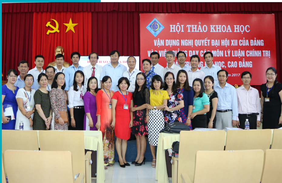
Ảnh lưu niệm.

kế nội dung chủ đề bài giảng, thực hành giảng bài đảm bảo tính khoa học; tránh hiện tượng vận dụng chung chung, không sát với nội dung môn học, bài học. Bên cạnh đó, chú trọng tính định hướng chính trị, giáo dục đạo đức, phong cách; rèn luyện về phương pháp tư duy, khả năng vận dụng giải quyết tình huống thực tiễn cho sinh viên.